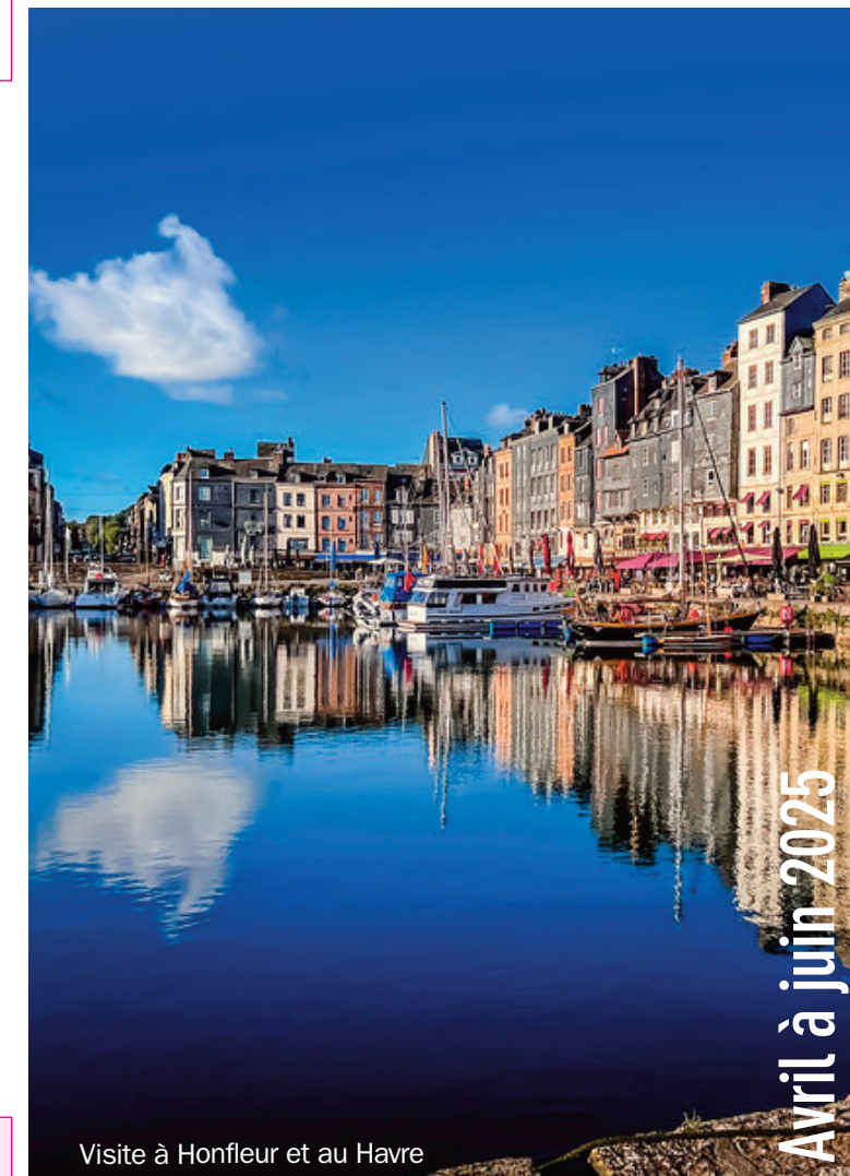
Visite à Honfleur et au Havre

Vous qui souhaitez nous rejoindre, soyez les bienvenus aux activités et aux sorties culturelles.